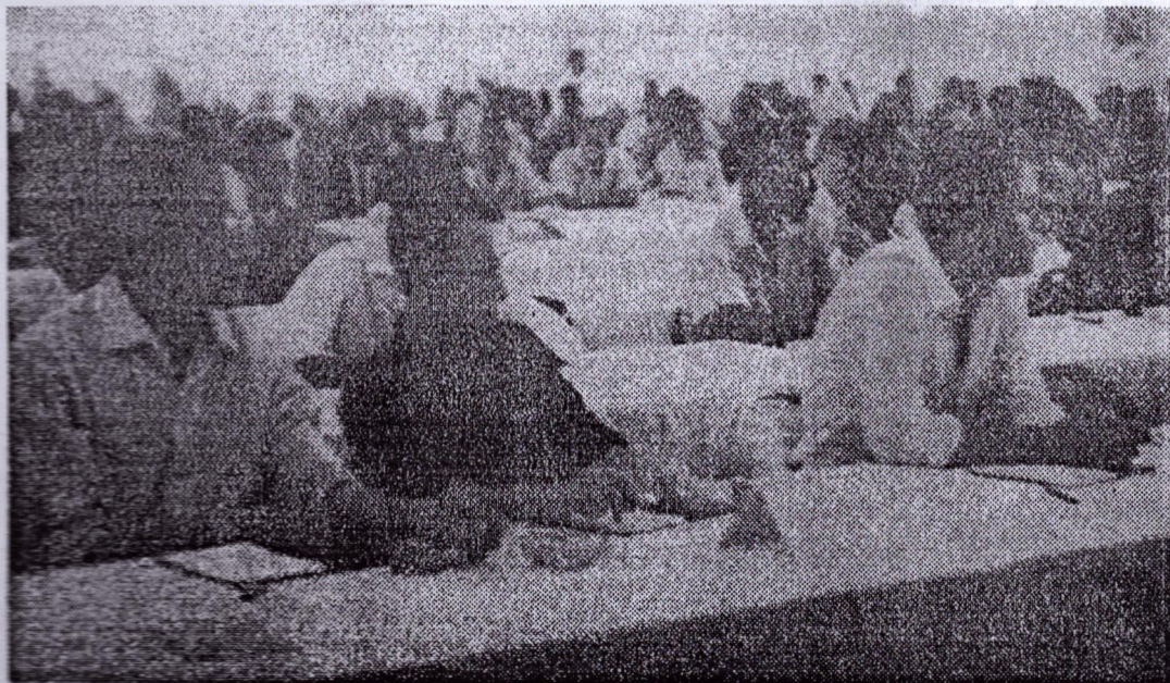
IMAGE DE LA CONFERENCE DES ORGANISATIONS DE JEUNESSE EN SOLIDARITE AVEC LES PEUPLES SOUS DOMINATION DU PORTUGAL

La Conférence de solidarité des organisations de jeunes du monde avec les peuples sous domination portugaise vient de clôturer ces travaux dans l'enthousiasme et la foi dans la certitude de la victoire du combat des peuples opprimés contre l'impérialisme, le colonialisme ancien et nouveau.